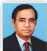
Sajjatuz Jumma Member