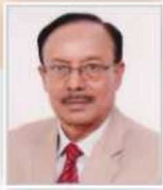
CHAIRMAN BOARD OF TRUSTEES